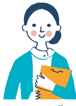
Assistante de direction