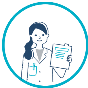
IDEST : Infirmier en santé au travail