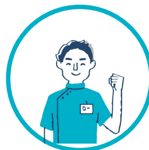
ATST : Assistant Technique en Santé au Travail