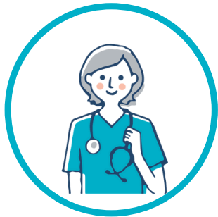
Médecin du travail