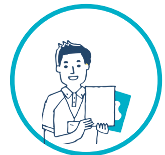
Fonctions support (Équipe siège social)